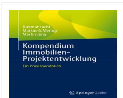
> Kompendium Immobilien-Projektentwicklung