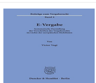
> E-Vergabe - Systematische Darstellung der Vorschriften des Vergaberechts im Lichte der europäischen Richtlinien