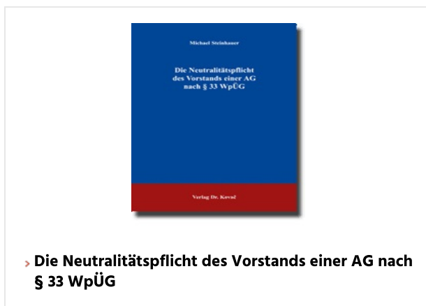
> Die Neutralitätspflicht des Vorstands einer AG nach § 33 WpÜG