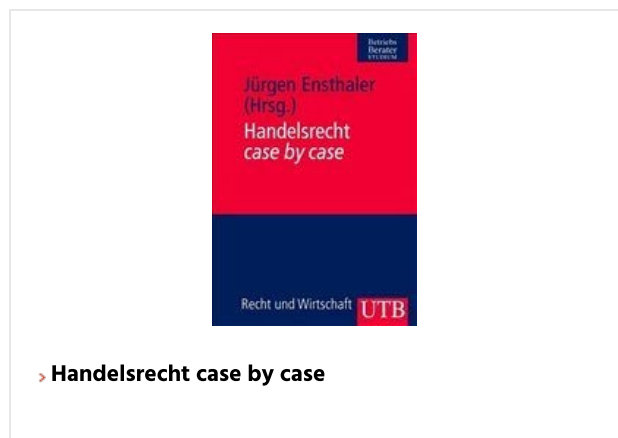
> Handelsrecht case by case