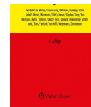
> Kommentar zum GWB-Vergaberecht