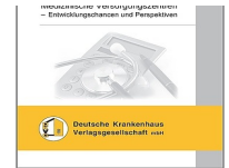
> Medizinische Versorgungszentren - Entwicklungstendenzen und Perspektiven