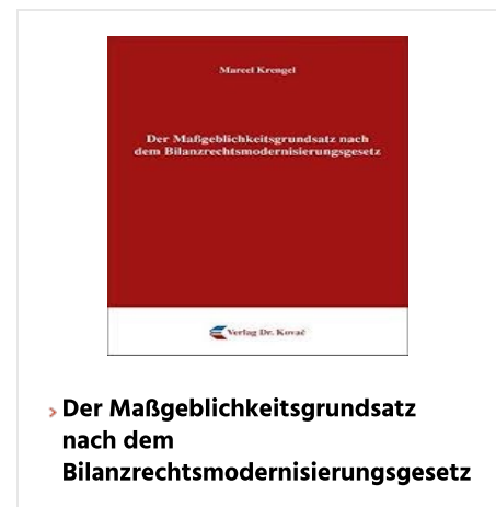
› Der Maßgeblichkeitsgrundsatz nach dem Bilanzrechtsmodernisierungsgesetz