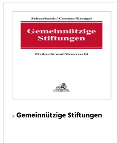
› Gemeinnützige Stiftungen