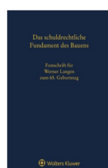
› Das schuldrechtliche Fundament des Bauens - Festschrift für Werner Langen zum 65. Geburtstag