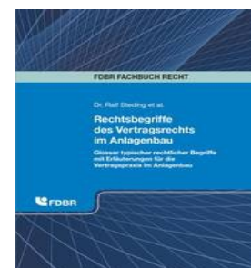
› Rechtsbegriffe des