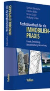
› Rechtshandbuch für die Immobilienpraxis